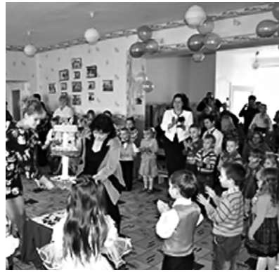
випадку із дитячим садочком «Джерельце»: крім обласного бюджету, гроші були виділені місцевим бюд-

жетом та спонсорами. У результаті дошкільний заклад, якому в ці дні виповнилося 25 років, увійшов в осінньо-зимовий період з теплом. У цьому переконався голова обласної ради Тарас Кремінь, якого запросили на дитяче свято до Улянівки. Ще десять років тому приміщення садочка знаходилися майже в аварійному стані. Були часи, коли його зовсім зачиняли. Сьогодні він приймає 90 дітей, які оточені турботою і любов'ятелів, і сільської ради, де не збираються зупинитися на досягнутому і будуть шукати нові можливості. Цього разу для проведення у дитячому садочку «Джерельце» термосанації.